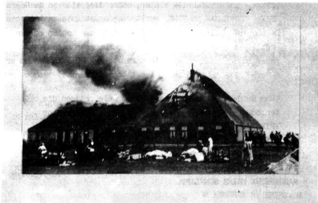
Brand van de Boerderij van ERIKS te Petten in juli 1941.