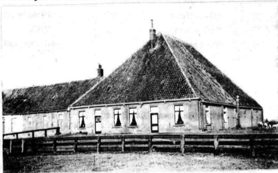
Boerderij van ERIKS te Petten. (Het meest linkse gedeelte was de Kaasfabriek).

De "Zijper Courant" en diverse particuliere (familie) archieven brachten dikwijls uitkomst.