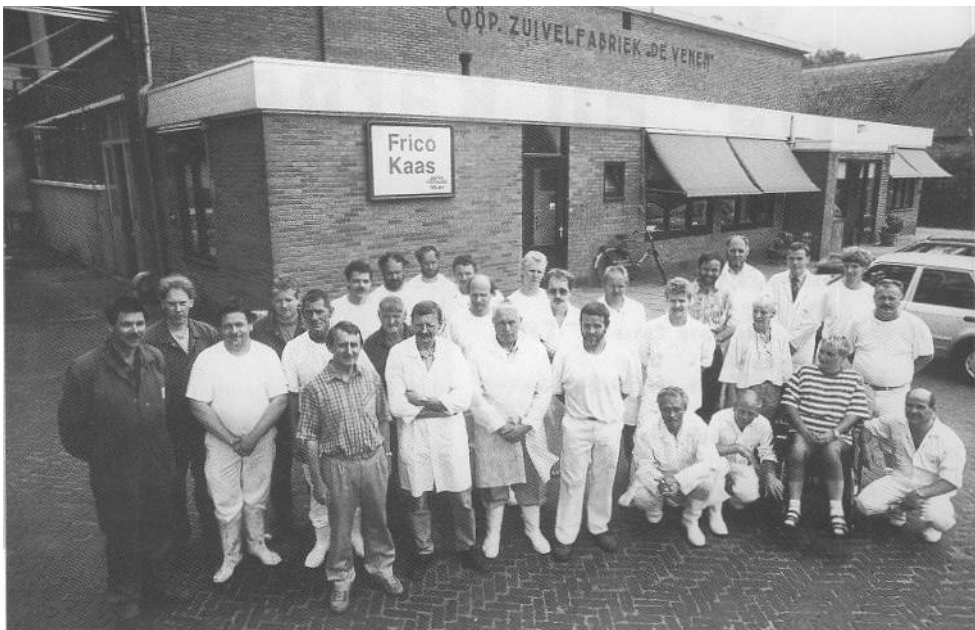
Het bijna voltallige personeel van het productiebedrijf van Frico Kaas in Kolderveen.

Het productiebedrijf van Frico Kaas in Kolderveen verwerkt circa 80 miljoen kg melk per jaar, waar circa 7800 ton folierechthoekkaas van verschillende samenstelling uit wordt bereid. Deze kazen wegen gemiddeld vijftien kilo. Op de fabriek in Kolderveen werken op dit moment 32 mensen. In juni van dit jaar gingen vijf medewerkers van Kolderveen in de seniorenregeling. Allen zijn vervangen door mensen uit de arbeidspool van FRIESLAND Frico Domo.