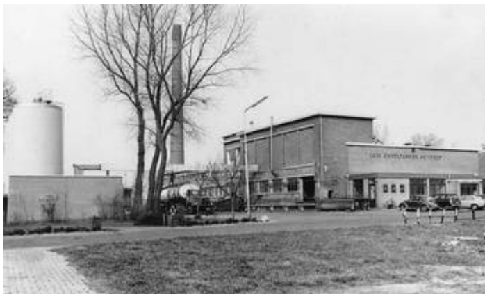
C.Z. Kolderveen jaren 70 ?

Wat niet is veranderd, betreft volgens de heer Boxem de instelling van de heer Jelsma tegenover het werk en tegenover zijn boeren. Daarvoor is respect ontstaan. Een menselijke aanpak was kenmerkend, zonder overigens het zakelijke uit het oog te verliezen. Deze houding is ook belangrijk geweest bij de fusie van de 3 fabrieken.