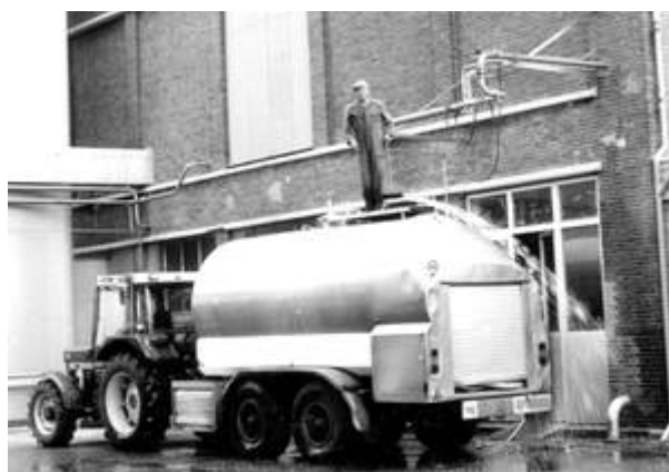
Trekker RMO bij fabriek in 1983

Eerder al in 1894, waren de veehouders uit dit gebied met één zuivelfabriek begonnen. Momenteel functioneert Kolderveen als kleine RMO-thuishaven. Met twee trekker-RMO-combinaties wordt op jaarbasis 48 mln. kilogram melk in Kolderveen bijeengebracht. „In het weidegebied tussen Meppel-Havelte en Steenwijk is de melkdichtheid dermate hoog dat de trekker RMO's aantrekkelijker zijn dan vrachtwagen RMO's" zegt directeur Jelsma. „Ik denk dat nergens in Nederland een gebied is te vinden met een dergelijke melkdichtheid", gaat hij verder. De in de 60-er jaren uitgevoerde ruilverkaveling in dit gebied noemt Jelsma als zeer belangrijk voor het gebied van „De Venen"