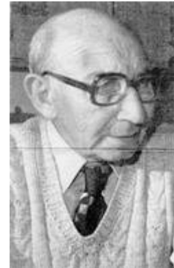
Dir. E. Mellens.

Het verhaal van de heer E. Mellens over zijn carrière op de Glimmer Melkfabriek lijkt op een Amerikaanse successtory. Begonnen als 13-jarige jongen in de fabriek is hij opgeklommen tot directeur. Met de fabriek zelf ging het niet zo voorspoedig; de melkfabriek 'De Toekomst' is nu verleden tijd. Zoals zovele kleine fabriekjes is deze opgegaan in de grootschaligheid.