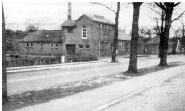
De Melkfabriek "De Toekomst" in 1948

De eerste tijd ging het prima. Er werkten nu 18 man in de fabriek. Maar de lonen werden alsmaar hoger, de melkprijzen trouwens ook, terwijl er geen extra melk verwerkt werd. Dit hing samen met het feit, dat de boeren bij de concurrentie 3 cent meer voor hun melk kregen. In 1966 werd alles overgedaan aan de Domo. De productie van boter en kaas werd stopgezet en de fabriek werd gebruikt als melkontvangstation. Na een jaar werd ook dit stopgezet.