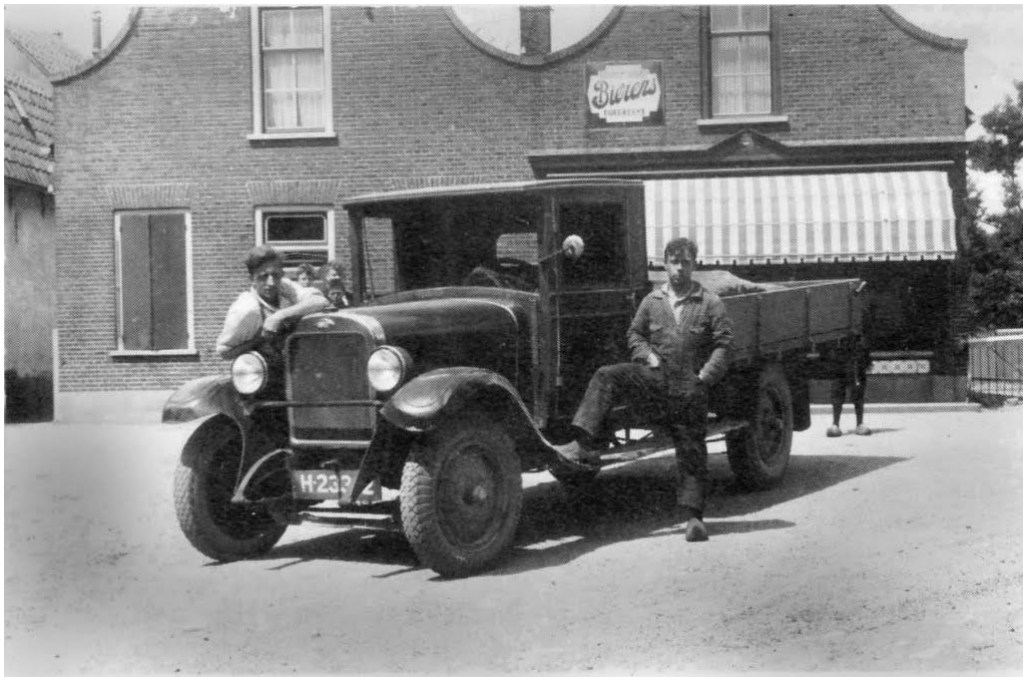
Vrachtauto van De Giessen , vermoedelijk van latere datum

— Doordat te ver werd uitgeweken voor een hondskar reed een auto van de zuivelfabriek de Giessen tegen de leuning van de heul in de Lage Giessen en bleef daartegen hangen. Een auto van de Graanmaalderij heeft hem weer op den weg getrokken. Persoonlijke ongelukken kwamen niet voor. Alleen de auto had wat schade.