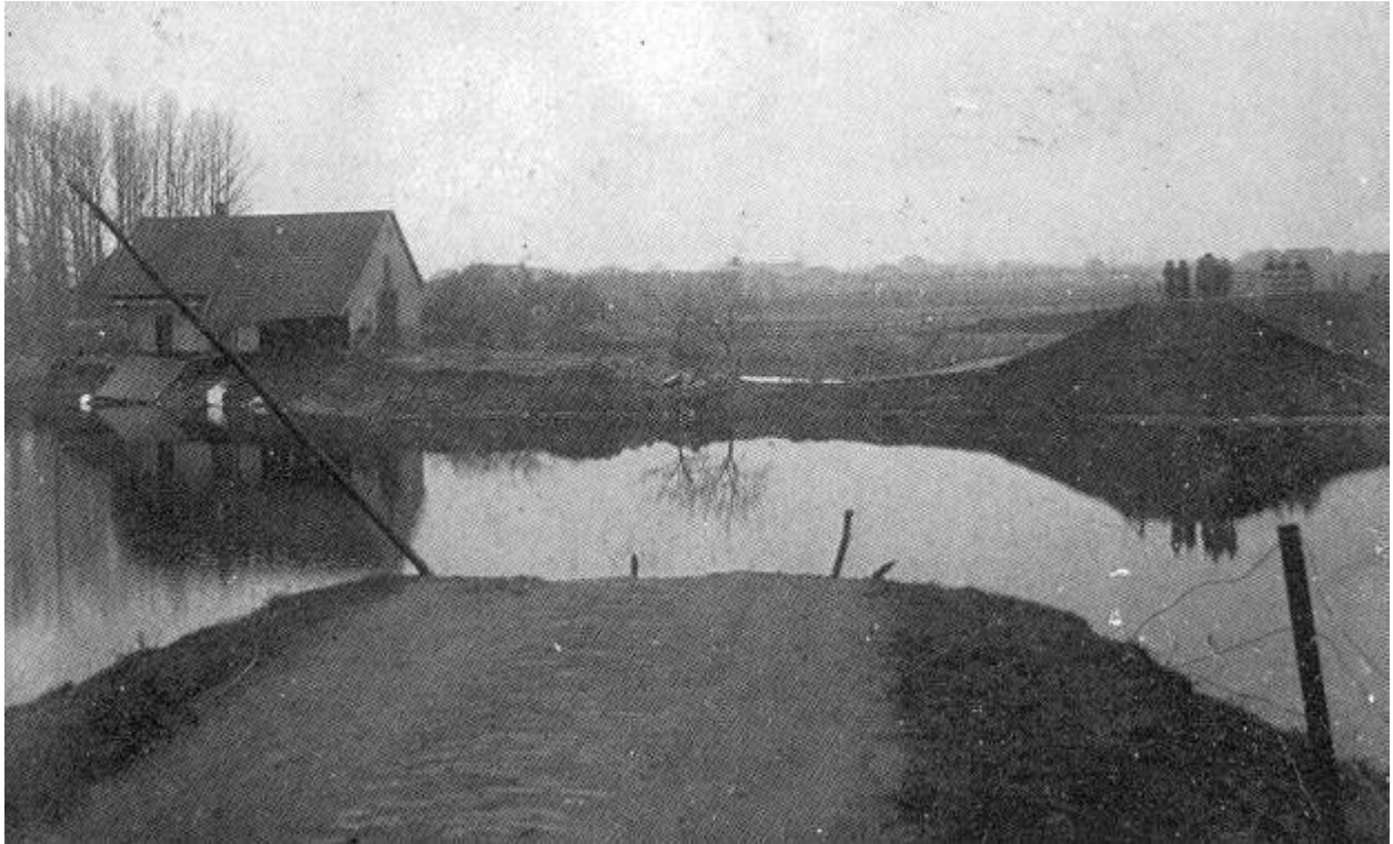
Twee foto's van de dijk doorbraak in de Deukerdijk bij Pannerden in februari 1926