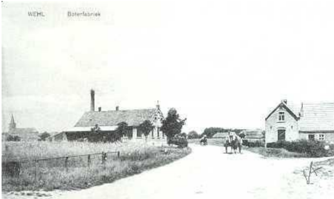
Wehl Boterfabriek ca. 1920