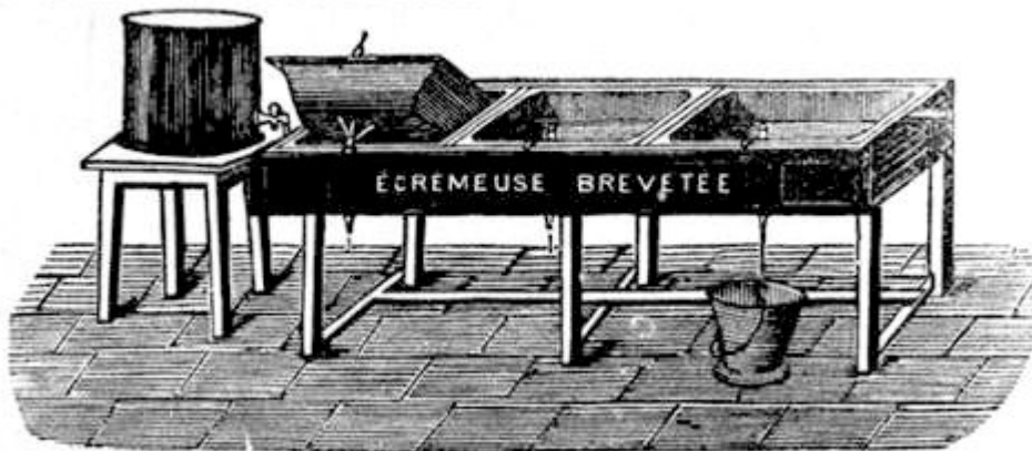
De Graafschap Bode 1892-11-12

't Ligt echter voor de hand, dat niet elke boerderij terstond volgens de nieuwste eisen kan worden ingericht en nu is het de vraag: wat te doen om in onze boterbereiding met weinig kosten verbetering aan te brengen? Om daartoe te komen zouden wij de écrémeuse of afkoelende roomafscheiders ten sterkste durven aanbevelen. In het buitenland (Duitsland, België, Engeland, Frankrijk enz.) zijn ze sinds vier à vijfjaren reeds in gebruik en we durven zeggen, dat zij daar algemeen reeds in gebruik zijn. In ons land zijn ze thans verkrijgbaar bij de firma Boeke en Huidekoper te Groningen.