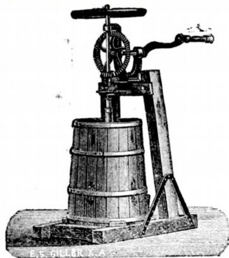
De Graafschap Bode 1892- 11-19

Een ongeluk voor de meeste boterboerinnen is het, dat de karnen veel te groot zijn. Wij hebben zelfs karnen van 80 – 100 liter gezien bij boeren, die twee á drie koeien bezitten. Het spreekt van zelf, dat de melk, die daar des winters hoogstens éénmaal in de veertien dagen ,