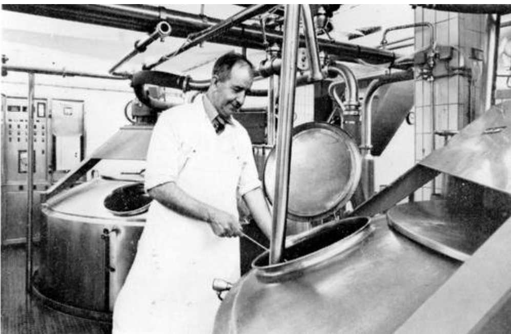
Het werken in een kaasmakerij vroeger en nu