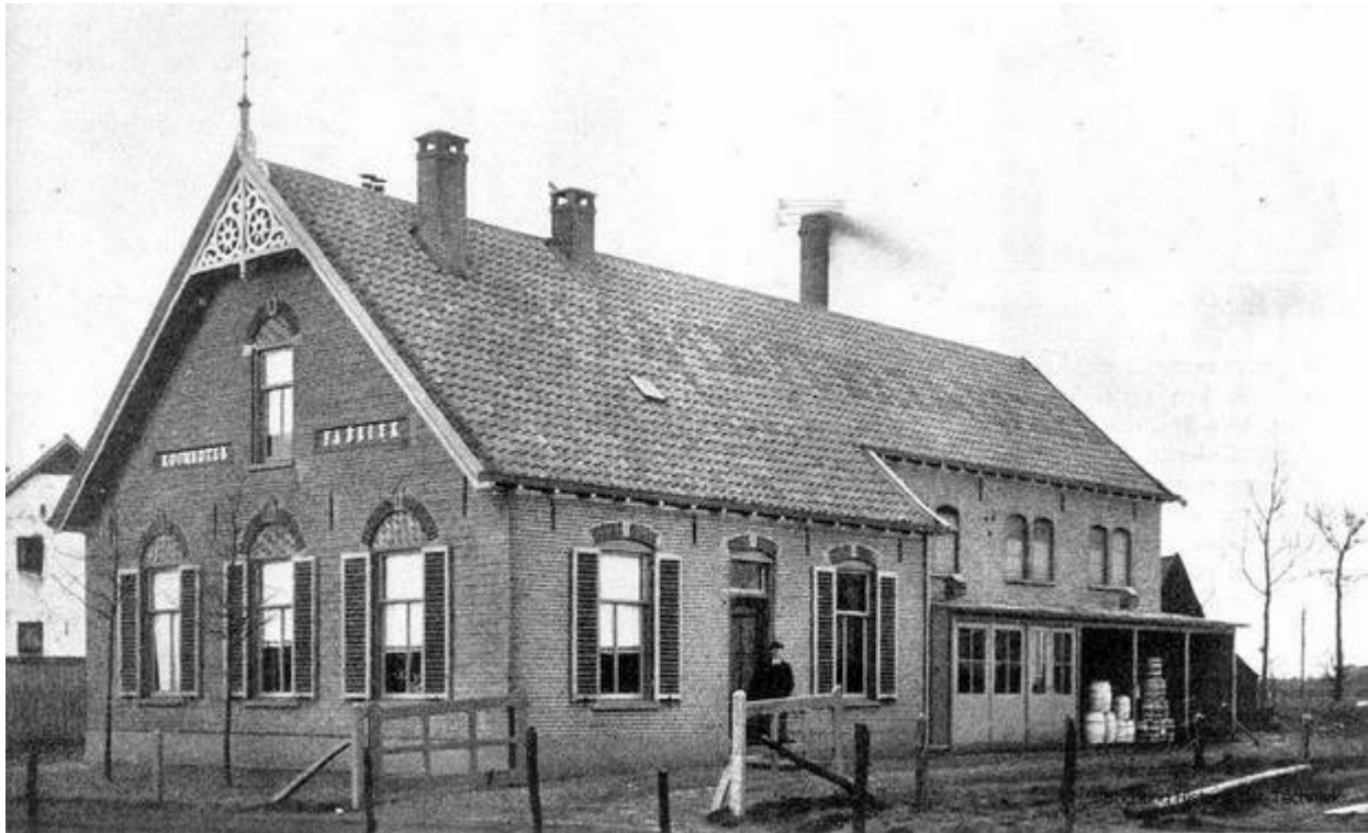
Opname van de 'Roomboterfabriek' te Didam.