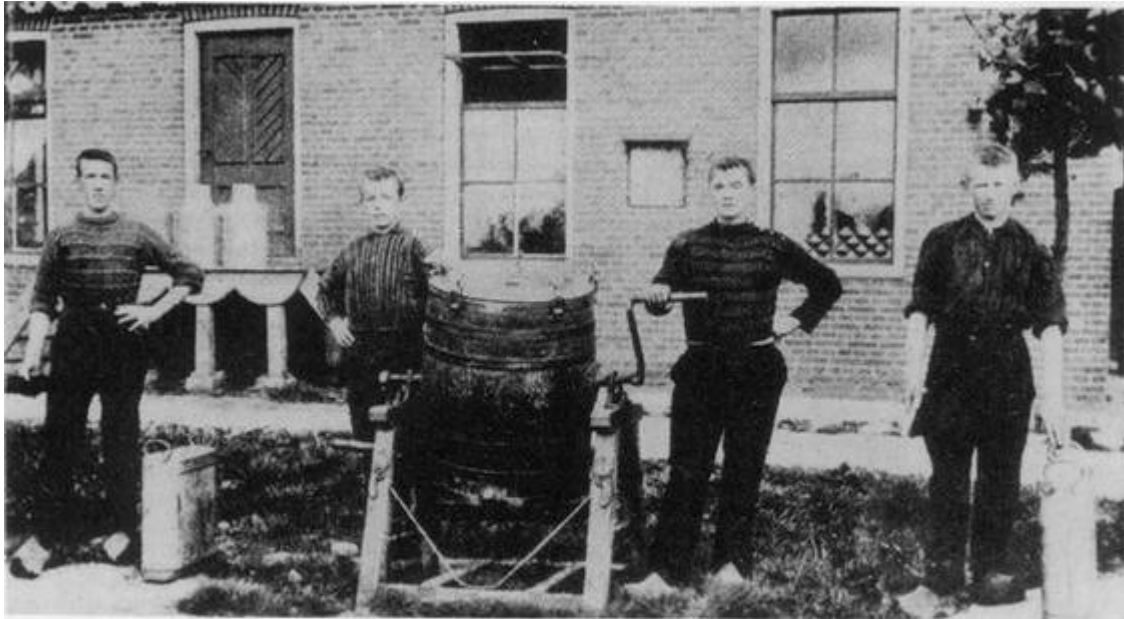
Het personeel van de coöperatieve handkracht-boterfabriek „Winne en Bunne” (1896) poserend voor de fabriek met tuimelkarn en ander gereedschap. In 1898 verwerkte dit fabriekje met behulp van 2 handkrachtcentrifuges 428.200 l melk. (uit: herdenkingsboekje, 1946)

De stoomzuivelfabriek te Eext. In deze fabriek ging men rond de eeuwwisseling van handkracht op stoom over. Als handkracht-fabriek verwerkte men er in 1898 ruim tweemaal zoveel als het fabriekje in Bunne en Winde. (foto: Drents Museum).