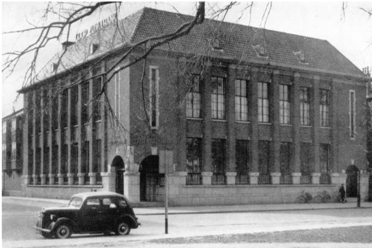
Coöperatieve Zuivelbank Friesland