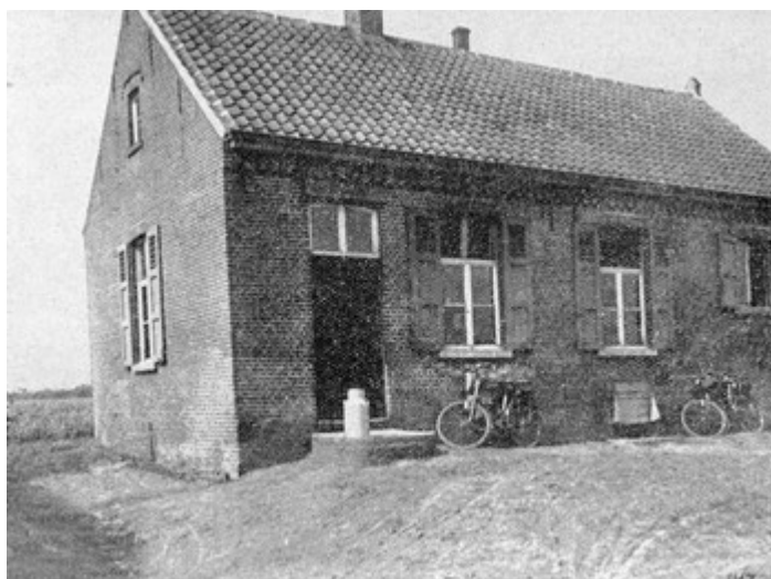
Oude fabriekje te Castelré

In sierlijke letters waren deze woorden getekend en boven de ingang aangebracht, toen de belangrijk verbouwde fabriek op feestelijke wijze in gebruik zou worden genomen. Het was dan ook voor de bewoners van Castelré een feit van bijzondere betekenis, zoals uit het volgende zal blijken.