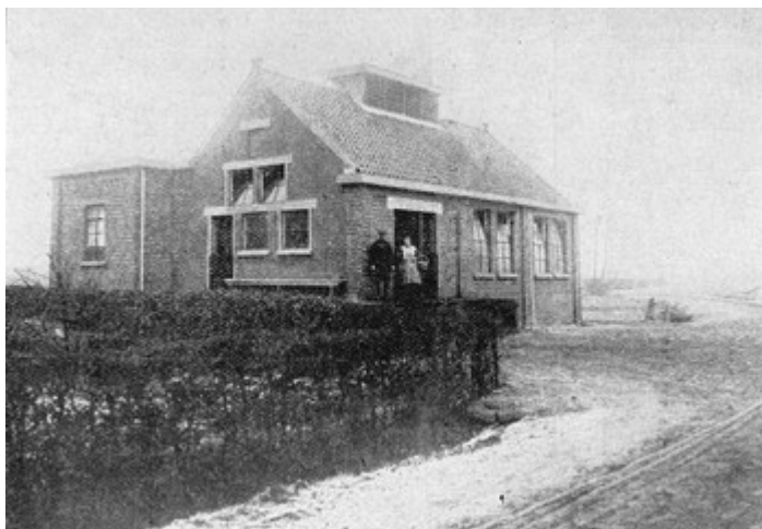
Nieuwe fabriek te Castelrë

Maar een verbouwing en aanschaffing van nieuwe machines zou veel geld kosten en daartoe over te gaan was voor dit plaatsje met zijn 350 inwoners een moeilijk besluit. Natuurlijk is aansluiting bij een andere fabriek overwogen, maar men meende dat zulks niet goed mogelijk zou zijn en vooral Castelrë miste niet gaarne een eigen zuivelcoöperatie. En zo heeft het thans een moderne, keurig ingerichte en doelmatig ingedeelde, maar kleine zuivel-fabriek.