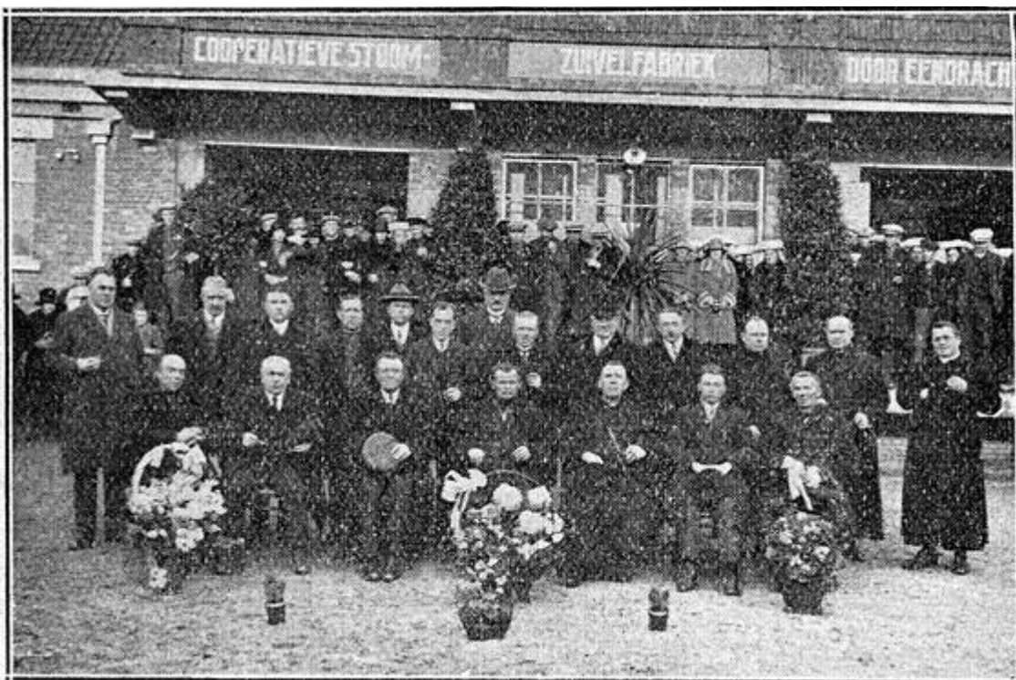
Opening der Coöp. Zuivelfabriek te Nistelrode. Bestuur met genoodigden: daarachter de leden.

Spr. feliciteert de leden met het tot stand gekomen werk en is er van overtuigd, dat de nieuwe fabriek onder Gods zegen een schoone toekomst zal tegemoet gaan, tot heil van den Boerenstand van Nistelrode.