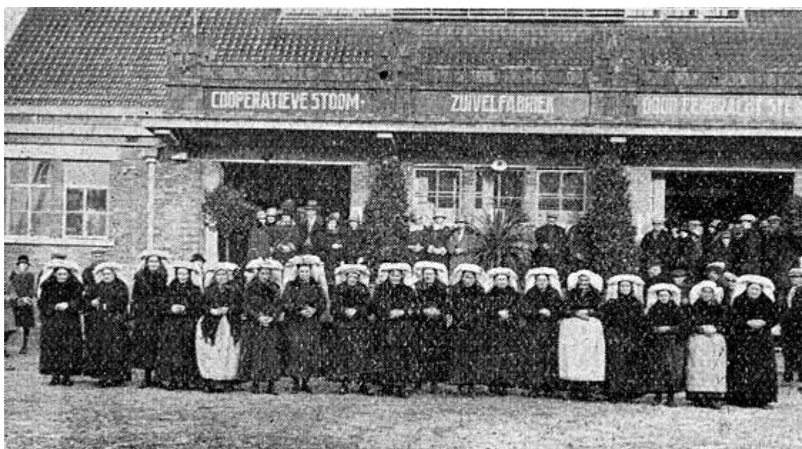
Groep boerinnen met Brabantsche kap voor het nieuwe fabrieksgebouw.

Naast het centrifugelokaal bevindt zich de machinekamer, waarin zijn opgesteld een staande 35 P.K. stoommachine, fabricaat Walschaert, Brussel, en een koelmachine van 20000 cal. fabricaat Phoenix Gent. In het ketelhuis, welke plaats biedt voor twee stoomketels, ligt een ketel van 30 M 2 . v. o., fabricaat Hagoort, Tilburg.