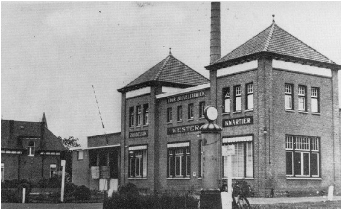
Zuivelfabriek 'Westerkwartier' Marum

Herhaalde malen reeds waren in de omgeving van Marum pogingen aangewend om de daar gelegen boterfabriekjes ook voor kaasbereiding in te richten. Vooral de Friesche boeren, die zich, naarmate de ontginning van heide tot grasland voortschreed, daar steeds talrijker kwamen vestigen, drongen op kaasmakerijen aan. Zonder deze wilden zij geen lid der fabrieken worden. De Groningers wilden daar echter aanvankelijk niet aan, daar zij de ondermelk voor hun jongvee en varkens terug verlangden. Pas de veranderde prijsverhoudingen na 1914 dwongen hen om - zij het ook zeer eenvoudige, soms zelfs primitieve - kaasmakerijen aan de fabrieken te verbinden.