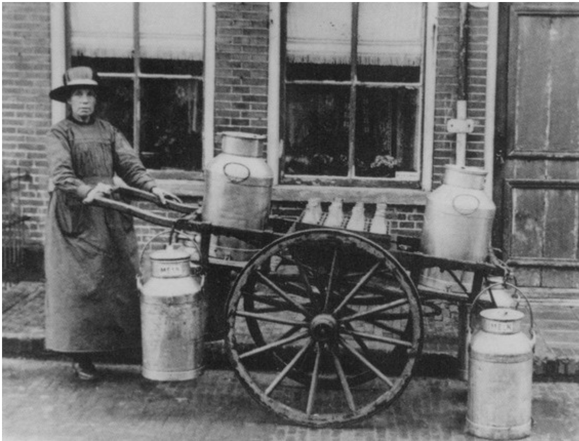
Koemelkster ca. 1910

Houdt de fabriek in de eerste jaren voldoende melk - en als de zuivelprijzen niet abnormaal laag worden in verhouding tot [229] die der akkerbouwproducten bestaat daarop veel kans, daar het ledental weer stijgende is en willekeurige uittreding praktisch onmogelijk is (boete bij uittreding f 500 per koe) - dan mag, dank zij de plaats vindende flinke afschrijvingen, worden verwacht, dat haar positie weldra gezond zal zijn, en zal deze fabriek een steun voor de veehouderij in het Noorden der provincie blijken.