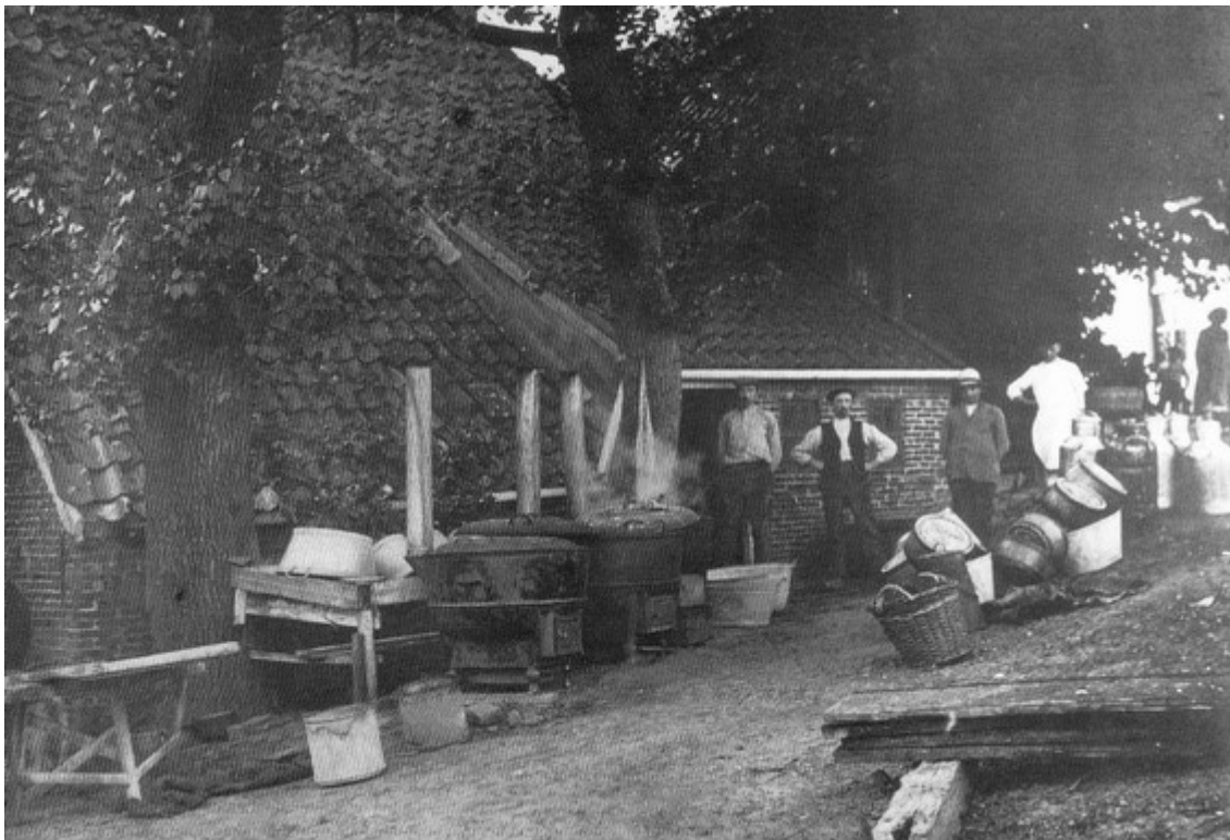
Zuivelfabriekje Adorp ca. 1900

„Op gelijke wijze is voor eenige jaren te Winschoten eene zuivelfabriek tot stand gekomen. De melk wordt voor rekening van de onderneming, in opzettelijk voor dat doel vervaardigde blikken bussen van 10, 20, 30 à 40 liter inhoud, dagelijks bij de leveranciers, landbouwers en daglooners in de omliggende dorpen, per as afgehaald en met winst iii verwerkt tot boter, kaas, karnemelk en hui.” iv