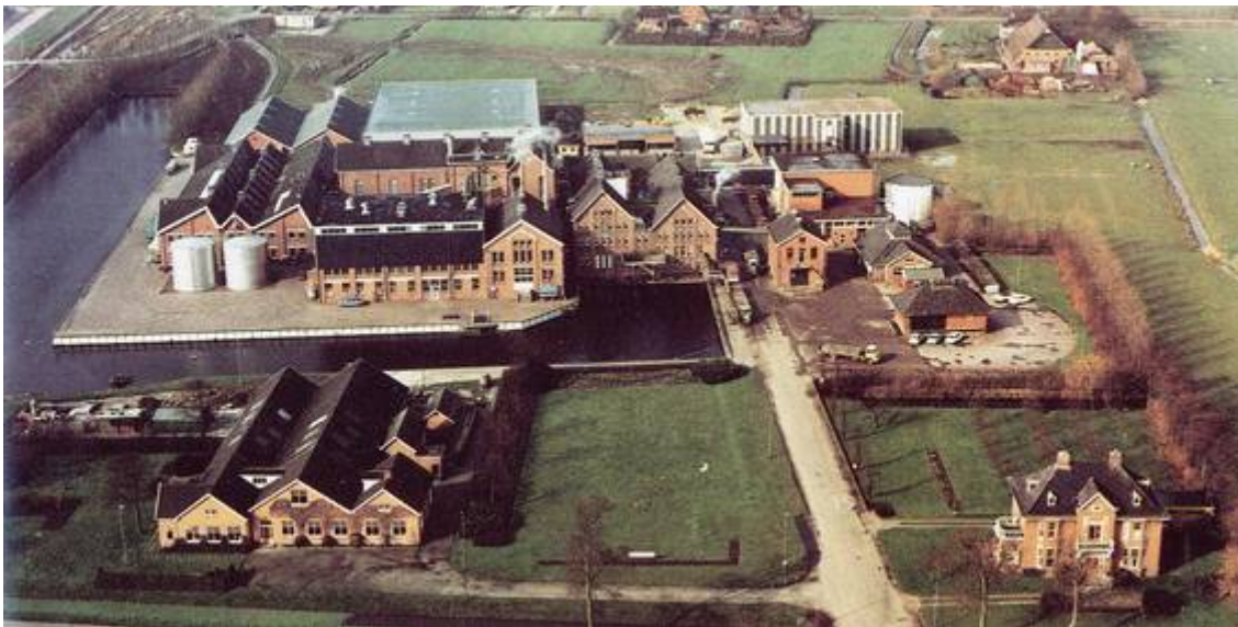
Coöperatieve Zuivelfabriek Bedum 1980