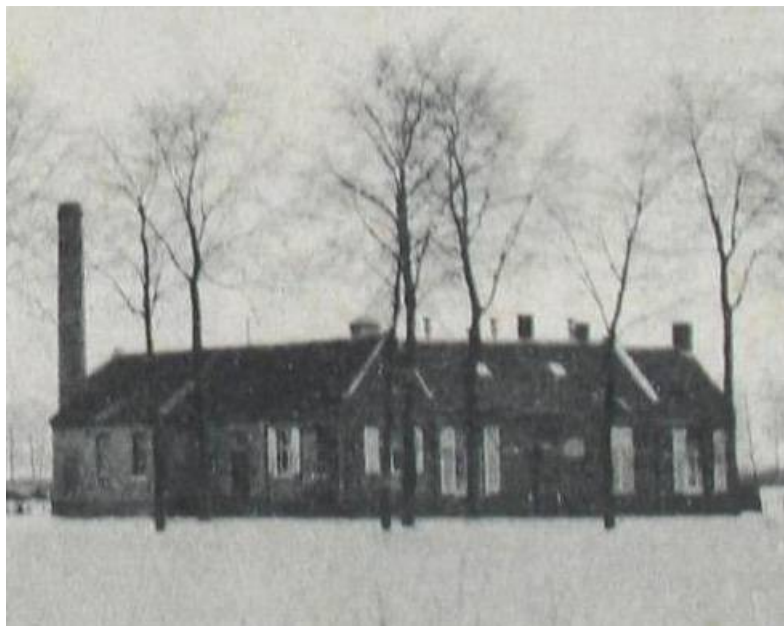
1906 1e Stoomzuivelfabriek