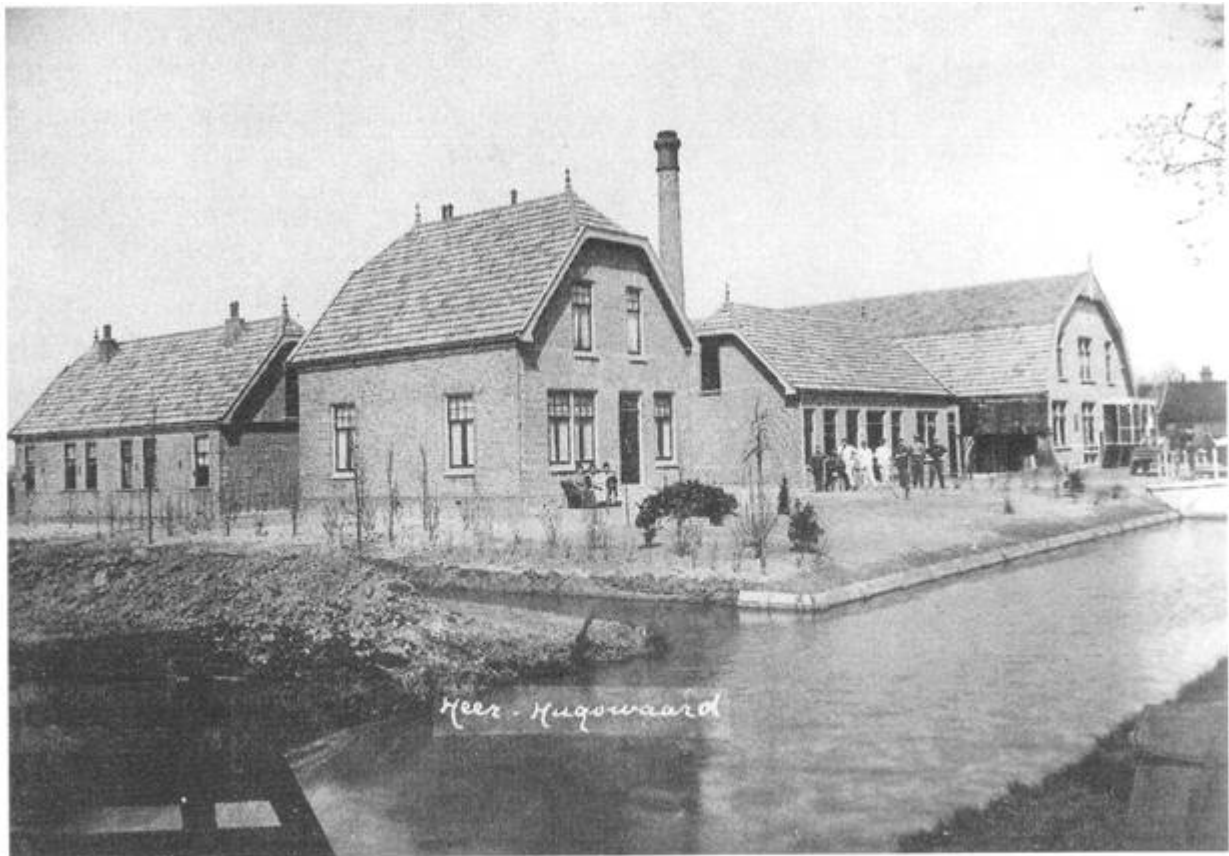
De coöp. zuivelfabriek 'Excelsior' aan de Middenweg in Heerhugowaard. In 1912 in bedrijf gesteld. Per 23 april 1961 een productiebedrijf geworden van 'Aurora' Op 10 januari 1981 gesloten.

In het voorjaar van 1912 werden door enkele veehouders in Oude-Niedorp pogingen in het werk gesteld om in plaats van de bestaande dagfabriekjes een kleine zoetfabriek op te richten in navolging van andere plaatsen. De vereniging werd reeds opgericht, welke den naam droeg „De Goede Verwachting” en het terrein was reeds gekocht.