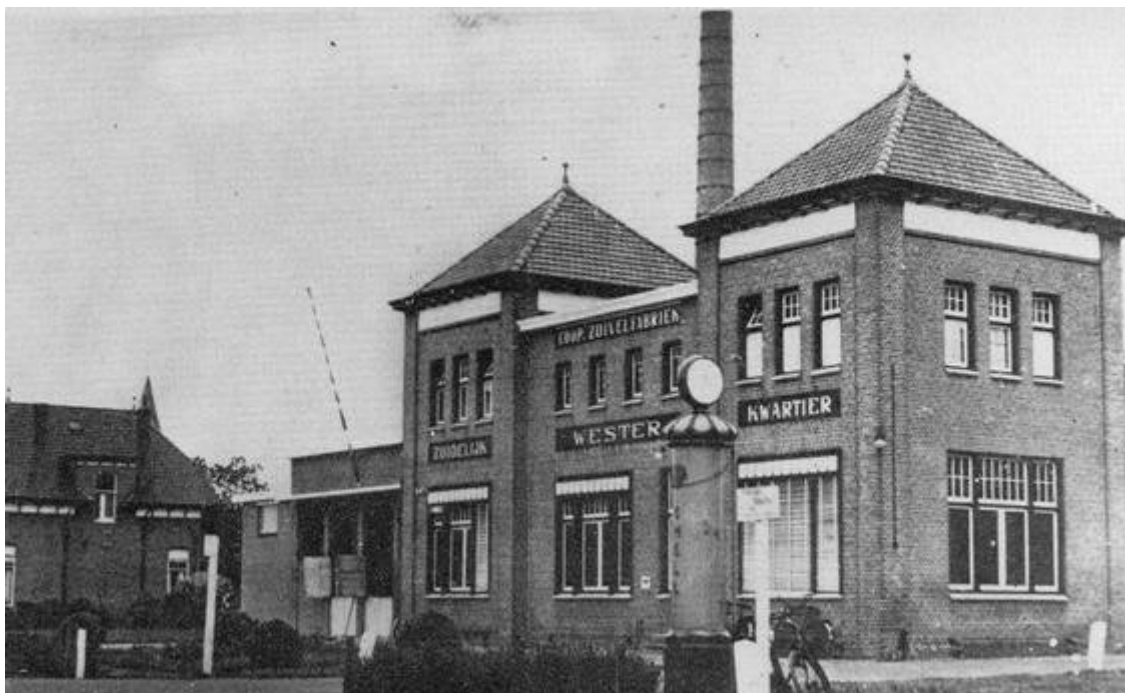
Zuivelfabriek 'Westerkwartier' Marum

Herhaalde malen reeds waren in de omgeving van Marum pogingen aangewend om de daar gelegen boterfabriekjes ook voor kaasbereiding in te richten. Vooral de Friesche boeren, die zich, naarmate de ontginning van heide tot grasland voortschreed, daar steeds talrijker kwamen vestigen, drongen op kaasmakerijen aan. Zonder deze wilden zij geen lid der fabrieken worden. De Groningers wilden daar echter aanvankelijk niet aan, daar zij de ondermelk voor hun jongvee en varkens terug verlangden. Pas de veranderde prijsverhoudingen na 1914 dwongen hen om - zij het ook zeer eenvoudige, soms zelfs primitieve - kaasmakerijen aan de fabrieken te verbinden.