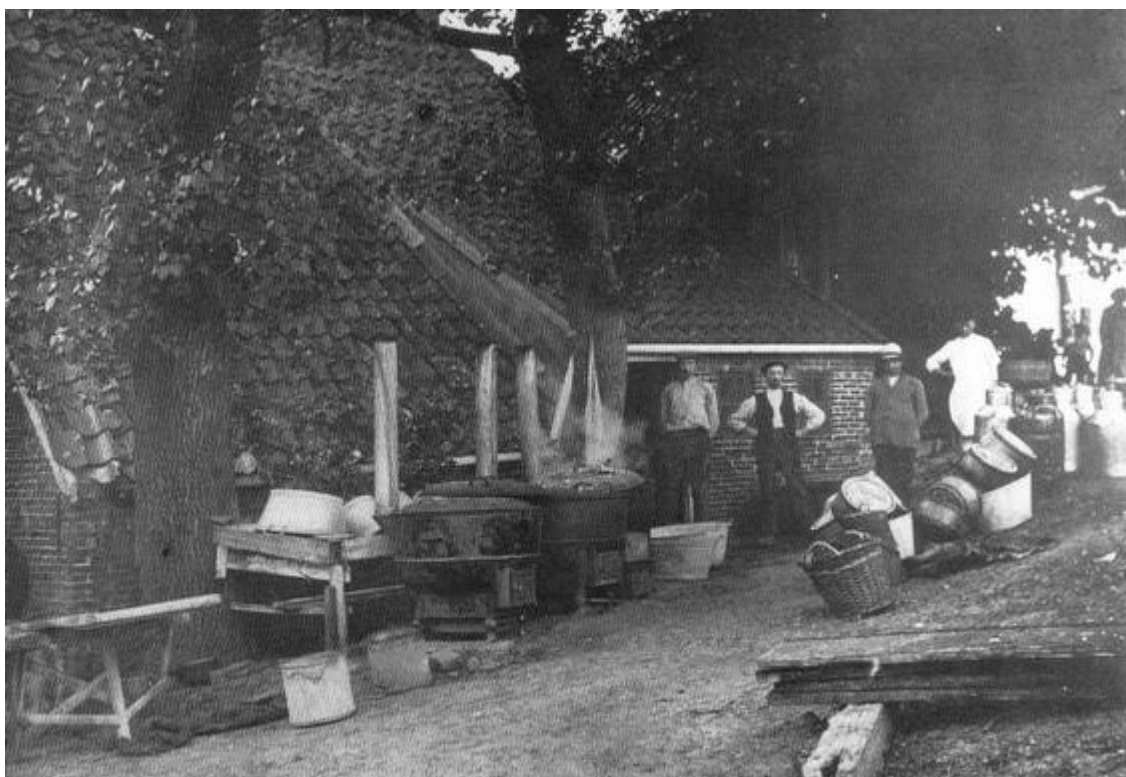
Zuivelfabriekje Adorp ca. 1900

„Op gelijke wijze is voor eenige jaren te Winschoten eene zuivelfabriek tot stand gekomen. De melk wordt voor rekening van de onderneming, in opzettelijk voor dat doel vervaardigde blikken bussen van 10, 20, 30 à 40 liter inhoud, dagelijks bij de leveranciers, landbouwers en daglooners in de omliggende dorpen, per as afgehaald en met winst iii verwerkt tot boter, kaas, karnemelk en hui.” iv